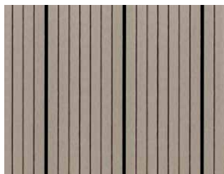
Easyplank Lysgrå, profil 01A.