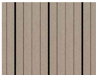
Easyplank Lysgrå, profil 01B.