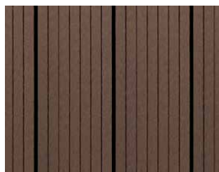
Easyplank Grafit, profil 01A.