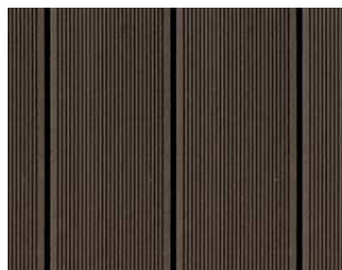
Easyplank Nero, profil 03A.