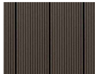
Easyplank Nero, profil 03B.