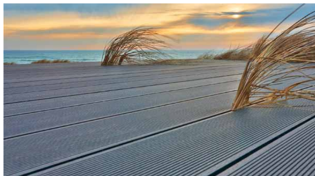
Easyplank Nero, profil 03A.