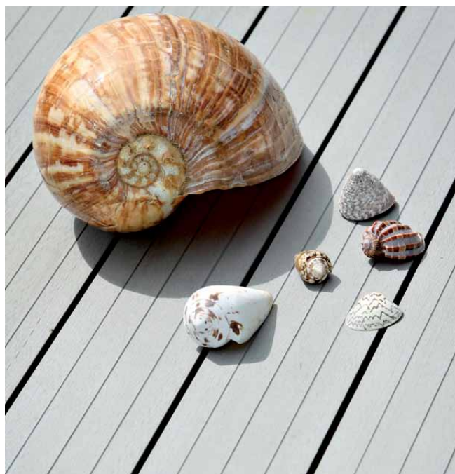
Easyplank Lysgrå, profil 01B.