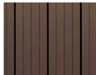
Easyplank Grafit, profil 01B.