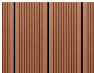
Easyplank Terracotta, profil 02A.