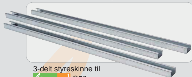
3-delt styreskinne til limusone 1 G50