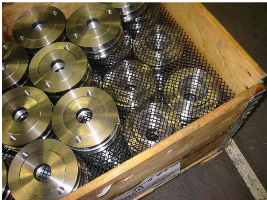
Her kan man se, hvordan pallemellemlæg (type 31) effektivt beskytter stablede emner.

EXPO-NET's pallemellemlæg er både holdbare og miljøvenlige!