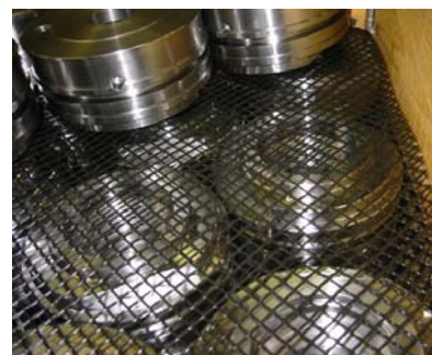
Pallemellemlæg type 31 her anvendt til adskillelse af flere lag emner.

Vi leverer endvidere pallemellemlæg i størrelser udarbejdet efter specifikke kundeønsker, og vi kan derudover tilbyde et bredt udvalg af forskellige farver, maskestørrelser, styrker og struktur.